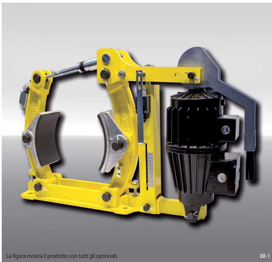
La figura mostra il prodotto con tutti gli optional